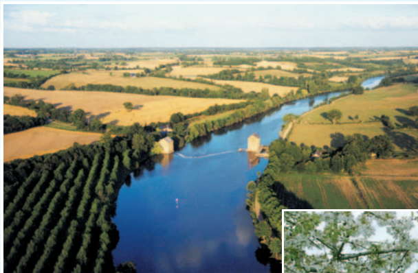
Schéma d'Aménagement et de Gestion des Eaux de la Mayenne